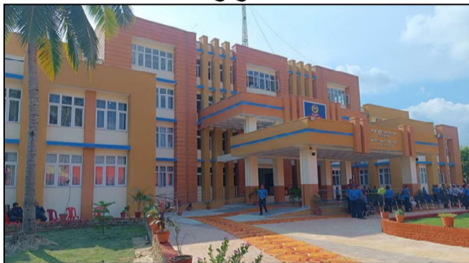
प्रहरी कर्मचारी छन्।