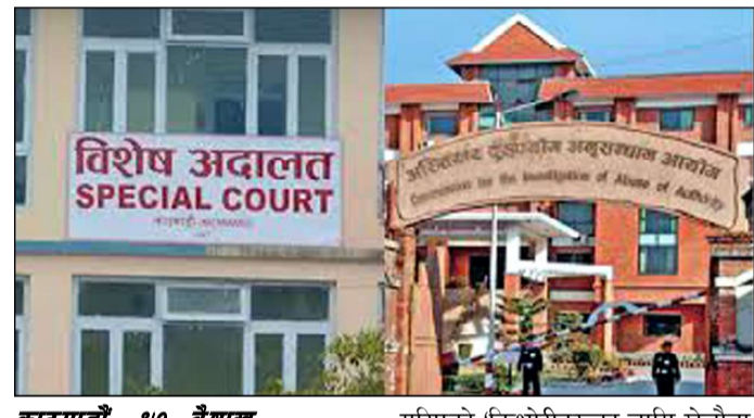
काठमाडौँ, १७ बैशाख

विपद्को समयमा प्रत्येक वडाबाट युवाहरूलाई परिचालन गरी उद्धार तथा राहत कार्यका लागि छुट्टै टोली गठन गरिने प्रतिबद्धता जनाउनुभयो । साथै, जनप्रतिनिधिहरूको नेतृत्वमा समन्वयात्मक विपद् व्यवस्थापन टोली निर्माण गरिने जानकारी पनि दिनुभयो । कार्यक्रममा प्रमुख जिल्ला अधिकारीले भाभ्र खोला, लालबकैया नदी र बागमती नदीका कारण जिल्लामा उच्च जोखिम रहेको उल्लेख गर्नुभयो । भारततर्फ निर्माण भएका बाँधका कारण प्रत्येक वर्ष रौतहट डुबानमा पर्ने समस्या कायमै रहेको उहाँको भनाइ थियो । साथै, हावाहुरी, चट्याङ र आगलागीका हिसाबले समेत रौतहट जोखिमयुक्त जिल्लाको रूपमा रहेको उहाँले स्पष्ट पार्नुभयो । उक्त कार्यक्रममा सशस्त्र प्रहरी बल, नेपाल प्रहरी, अनुसन्धान निकायका प्रतिनिधि, वडा अध्यक्षहरू, समाजसेवी, कर्मचारी तथा पत्रकारहरूको उपस्थिति रहेको थियो । स्थानीय तहमा विपद् व्यवस्थापनलाई प्रभावकारी, छिटो र समन्वयात्मक बनाउन स्थापना गरिएको यो केन्द्रले महत्वपूर्ण भूमिका खेल्ने अपेक्षा गरिएको छ ।