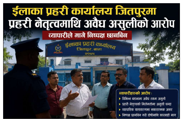
व्यापारीले मागे निष्पक्ष छानबिन

नाम नखुलाउने सर्तमा एक व्यवसायीले व्यापार सञ्चालन गर्नभन्दा प्रहरीको दबाव व्यवस्थापन गर्न कठिन भइरहेको गुनासो गरे। उनले मासिक